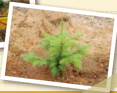
※都合により植樹場所が変更になる場合があります。