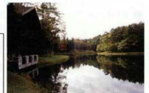
閑静なニドムの湖畔↑